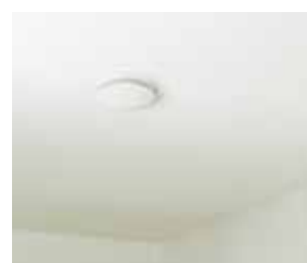
ComfoValve Luna E, plafondmontage